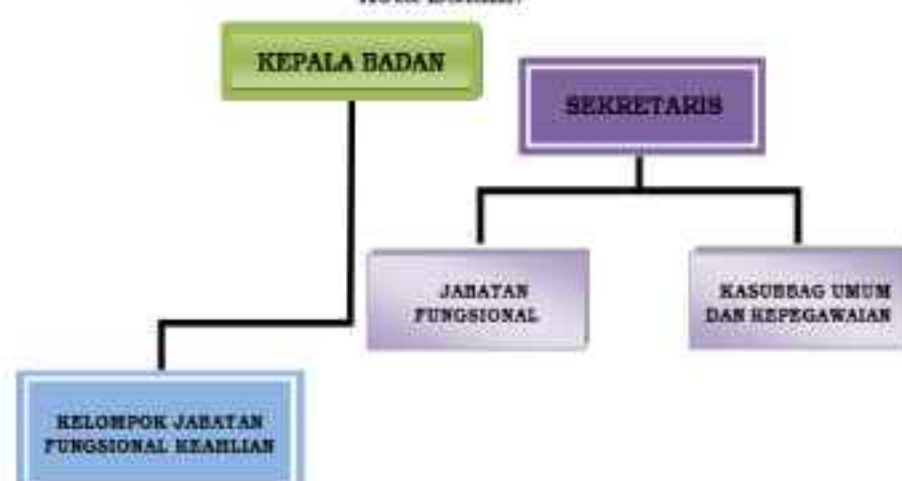
Gambar 2.1 Struktur Organisasi Badan Riset dan Inovasi Daerah Kota Batam.